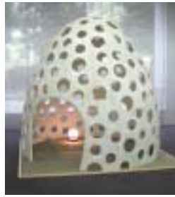
佳作 A-21. タマゴルーム [森田 一弥]