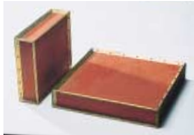
A-2. 都市の間隙043 [長澤 知明]