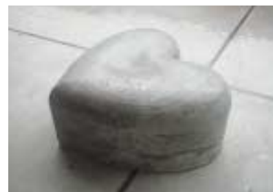
A-27. ハートチェア [村中 鉄也]