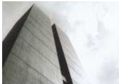
佳作 B-35. RE'Concrete [江口 明彦]