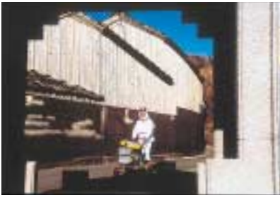
佳作 B-27. 額 [滝井 千恵子]