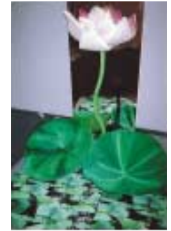
A-23. 開華(かいか) [足立 我]