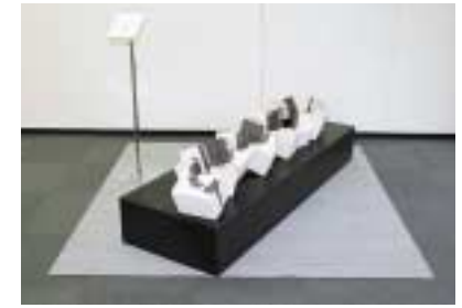
A-18. +1200 [大野 文嗣]