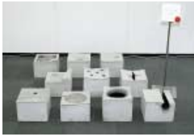
佳作 A-16. キュービクの展開 [川口 智慎]