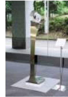
A-20. かぜのほほえみ [大塚 健二]