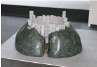
A-1. 時空の森 [北川 太郎]