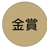
A-29. チーズ [ものづくり大学]

実験で使用した2.4tの高強度コンクリートを有効利用できないかと考え、ひたすらコアを抜くことにより、チーズの形にしてみた。