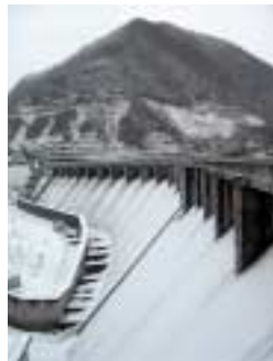
B-32. 風雪とともに [渡邊 弘子]