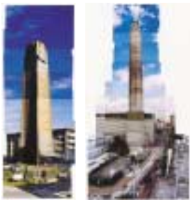
B-7. 煙突は無機質な象徴 [今 和明]