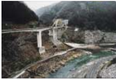
B-23. ダム工事現場 [北村 正人]