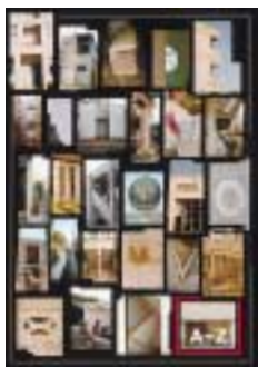
B-33. A ~ Z [梅田 拓]