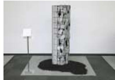
A-19. 共生 [佐賀大学 創美会]