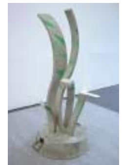
A-28. 春の息吹 [太平洋セメント]