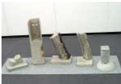
A-10. 5態の老人像 [西 陽稔]