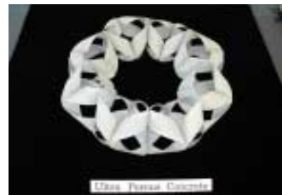
A-22. Ultra Porous Concrete [顯原 正美]