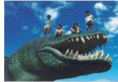
B-17. 恐竜 [大岡 雅人]