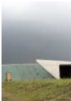
B-31. 大地 [九嶋 豊]