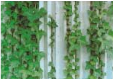
佳作 B-34. 共存 [松木 雄一]