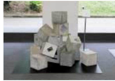
A-17. 連立 [安永 陽子]