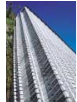
B-15. 高層ビル模様 [奥野 喜久雄]