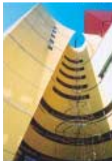
B-2. トライアングル [中尾 勇次郎]