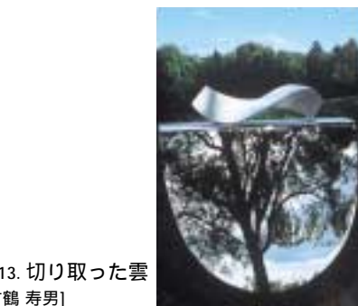
A-13. 切り取った雲 [竹鶴 寿男]