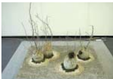
A-12. 和 [日本大学建築材料研究室]