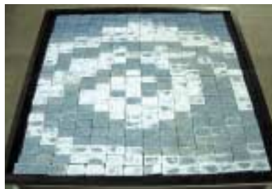
A-11. 白濁(はっか)現象 [徳島大学コンクリート・システム研究室]