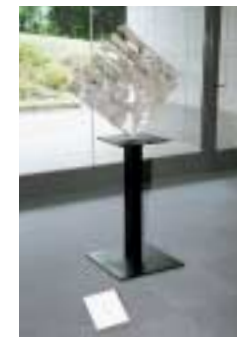
A-24. 再生 [吉野 祥太郎]